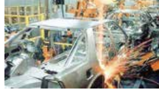
Otomotiv San. / Automotive