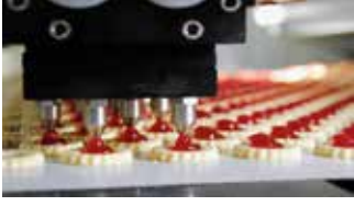
Gıda San. / Food