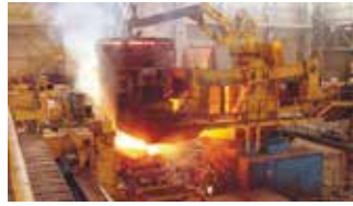
Döküm San. / Mould