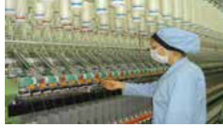
Tekstil San. / Textile