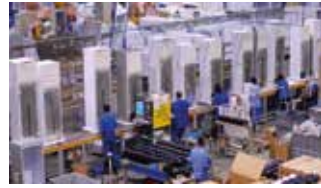
Beyaz Eşya San. / White Goods