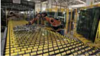
Cam San. / Glass