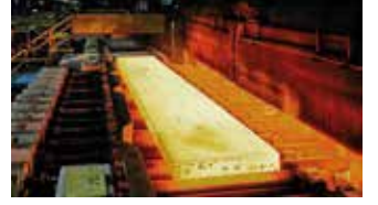
Demir Çelik San. / Iron and Steel