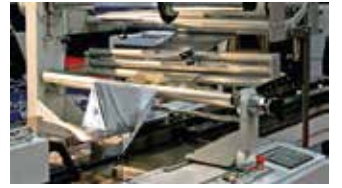
Ambalaj San. / Packaging